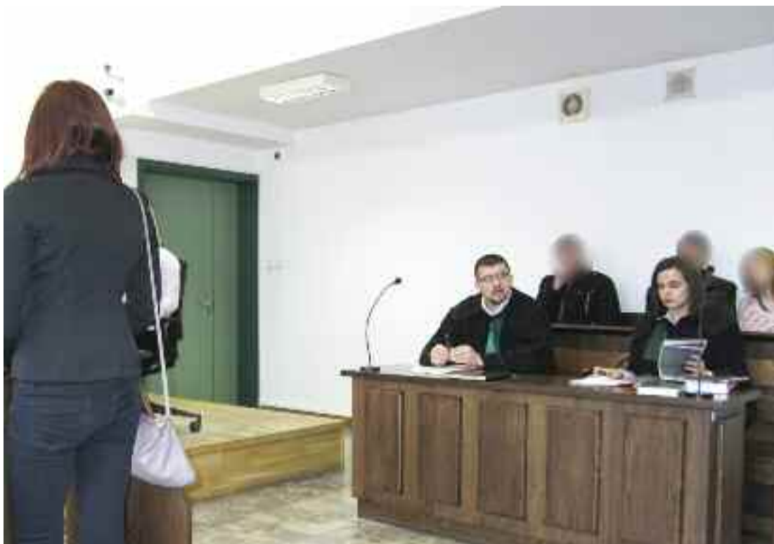
Klaudia D. występuje w tej sprawie tylko w charakterze świadka