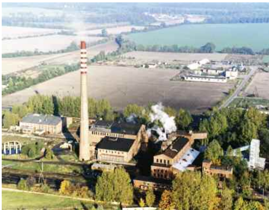
Pan Stanisław do dzisiaj nie może przeboleć likwidacji brykietowni